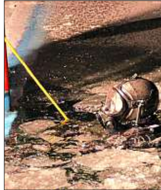
Ein Taucher geht hier unter das Eis des Schwimmbekkens.