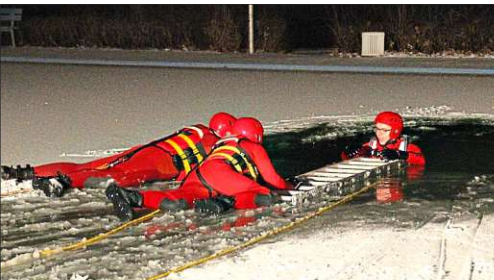
Hier wird die Rettung mit Hilfe einer Leiter durchgeführt.

Graffiti auf Garagenwand Töging. Eine Sachbeschädigung durch Graffiti meldet die Polizei: Zwischen 23. Januar, 20 Uhr, und 24. Januar, 8 Uhr, besprühte ein unbekannter Täter eine Garagenwand in der Königsberger Straße. Hinweise nimmt die Polizeiinspektion Altötting unter ☎ 08671/96440 entgegen. – red