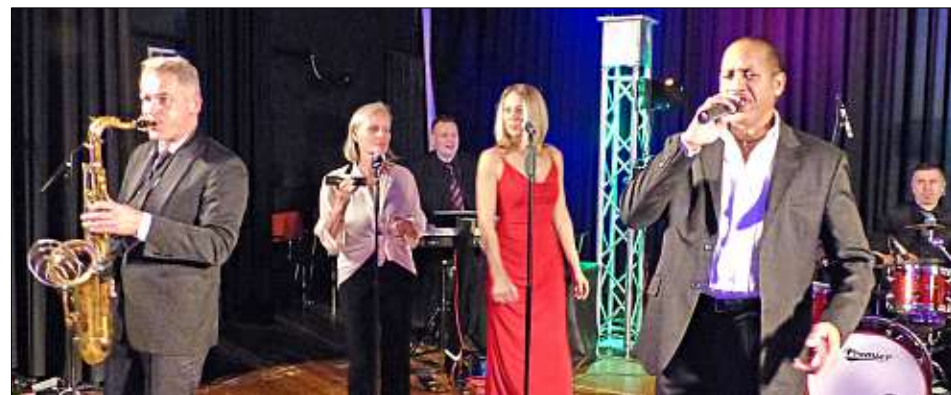
Lässig-cool spielte die Showband „up to date“ auf.