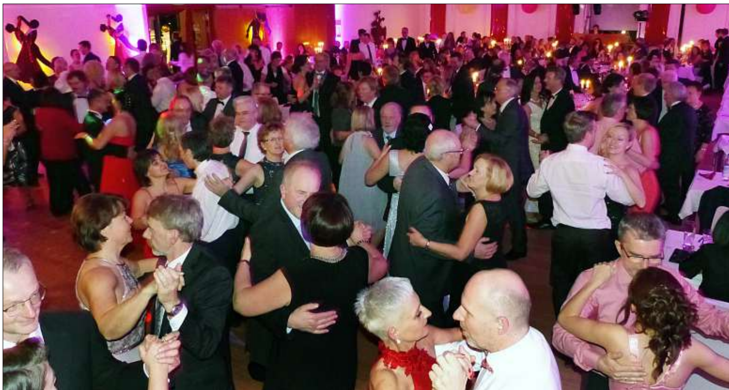
Die Ballbesucher zog es im stilvollen Ambiente und bei internationaler Musik in Scharen auf die Tanzfläche.

40. Ball des Werberings mit 300 Besuchern ausverkauft – Show-Band „up to date“ und „Los Chicos“ heizten den Gästen ein